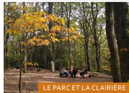
LE PARC ET LA CLAIRIÈRE