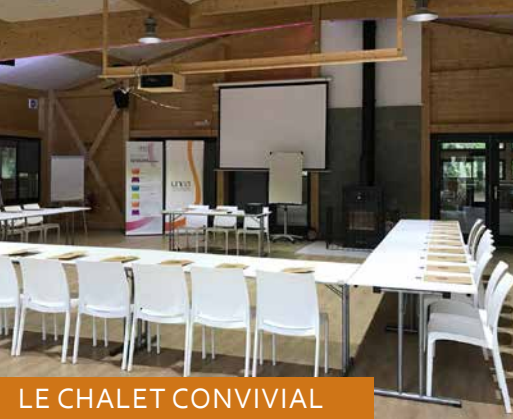
LE CHALET CONVIVAL