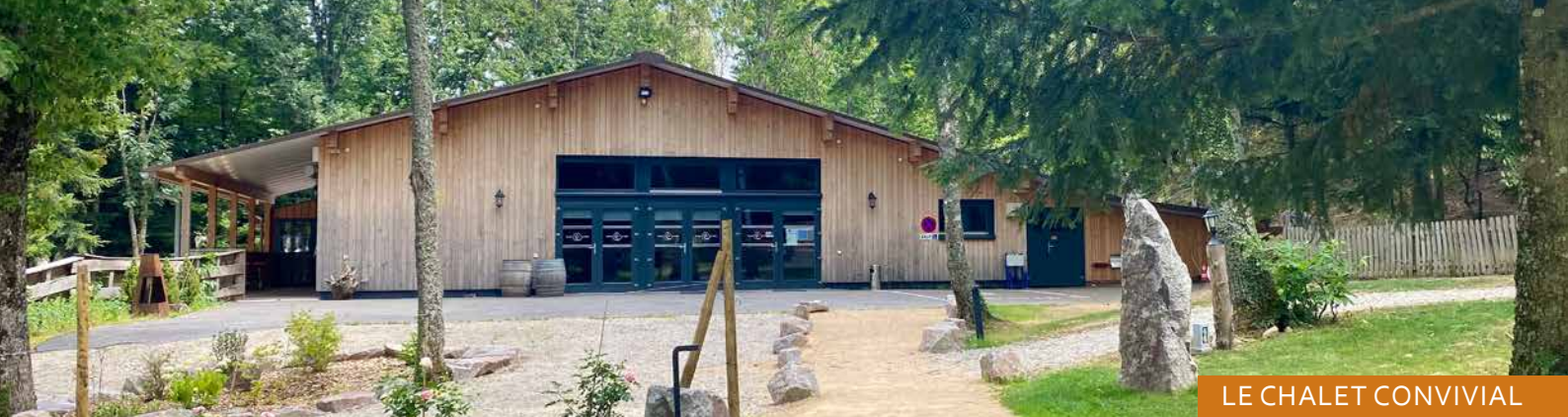
LE CHALET CONVIVAL