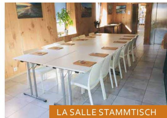
LA SALLE STAMMTISCH