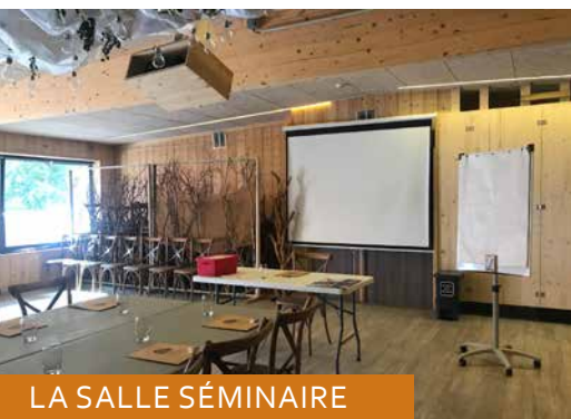
LA SALLE SÉMINAIRE